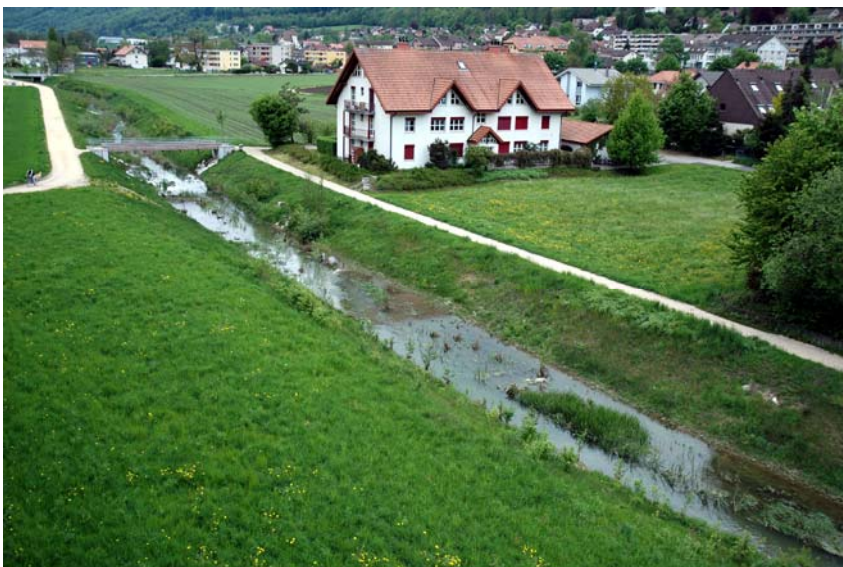
Abbildung 1: Aufgewerteter Abschnitt der Leugene bei Pieterlen.